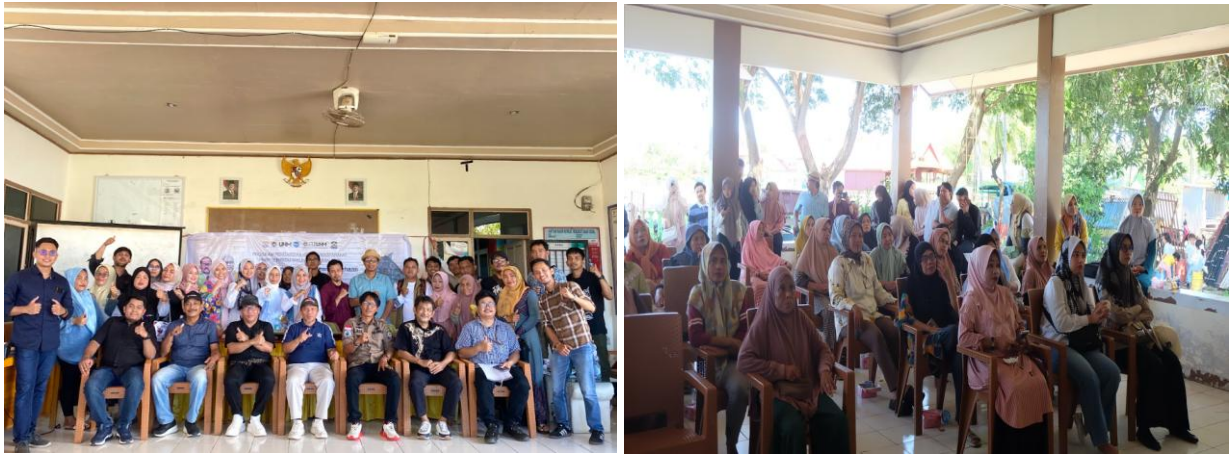
Gambar 2. Peserta PKM (dosen, mahasiswa dan mitra)

Proses pendampingan berlangsung baik dengan dukungan dari para narasumber dari tenaga pengajar (dosen) yang kompeten dan berpengalaman dalam memberikan pengetahuan tentang bagaimana tahapan-tahapan dalam mengimplementasikan konsep manajemen rantai pasokan bagi UMKM di Desa Tarowang, Kecamatan Tarowang, Kabupaten Jeneponto. Materi pelatihan disampaikan dengan bahasa dan cara yang mudah dipahami oleh para peserta, sehingga banyak tanggapan, pertanyaan, dan harapan yang mereka sampaikan.