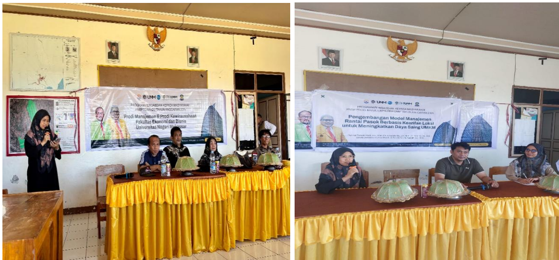
Gambar 2. Pemberian Materi

Proses pendampingan berlangsung baik dengan dukungan dari para narasumber dari tenaga pengajar (dosen) yang kompeten dan berpengalaman dalam memberikan pengetahuan tentang bagaimana tahapan-tahapan dalam mengimplementasikan konsep manajemen rantai pasokan bagi UMKM di Desa Tarowang, Kecamatan Tarowang, Kabupaten Jeneponto. Materi pelatihan disampaikan dengan bahasa dan cara yang mudah dipahami oleh para peserta, sehingga banyak tanggapan, pertanyaan, dan harapan yang mereka sampaikan.