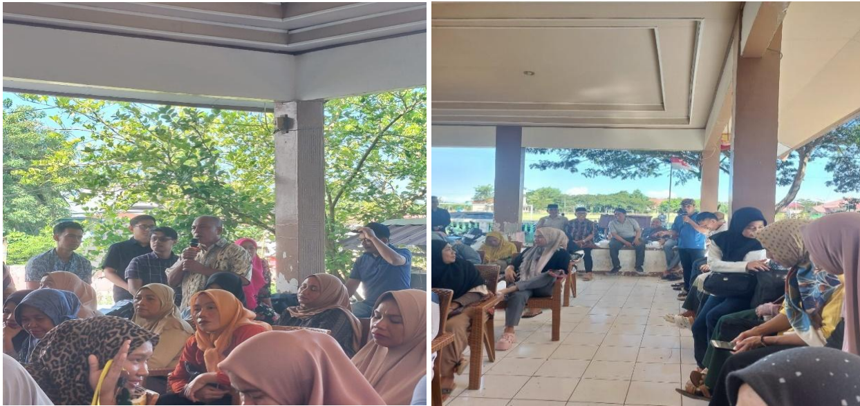
Gambar 3. Sesi diskusi

Hasil kegiatan pelatihan dan pendampingan ini memberikan beberapa pemahaman tentang implementasi konsep manajemen rantai pasokan dalam dunia bisnis bagi UMKM Desa Tarowang, Kecamatan Tarowang, Kabupaten Jeneponto, diantaranya adalah: